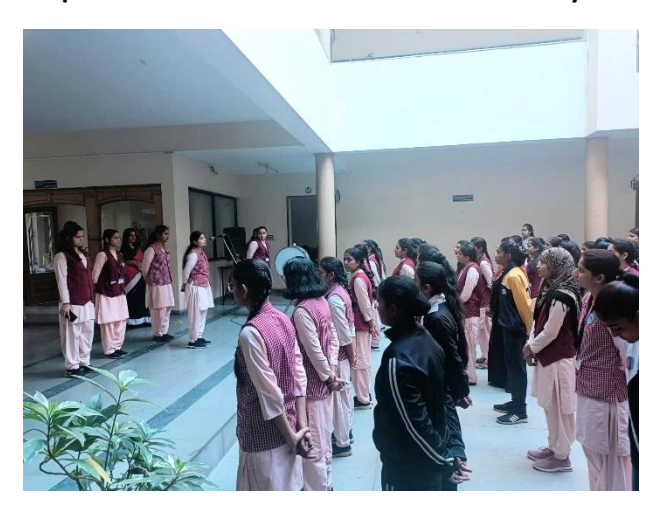
Unity Day Event