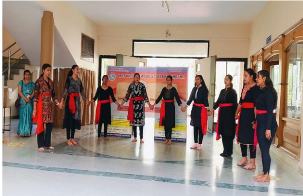
Seven Days NSS Camp Inaugurated