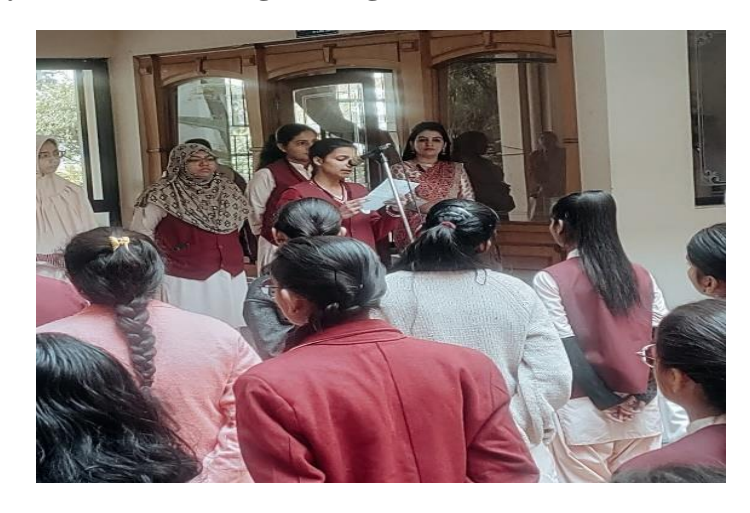
Various Programs organized on Jan Jatiya Gaurav Diwas and Constitution Day