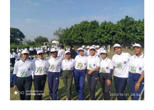
Bhartiya Bhasha Utsav Celebrated